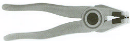
200.220 Green Runner Zöldműanyag törőfogó, egyenes és enyhén íves törésekhez, tartalék törőpofa párral. Hossza 203 mm, pofaszélessége 25 mm.