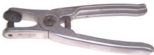
200.207 Silberschnitt törőfogó Elfordítható pofa teszi lehetővé akár a belső ívek kitörését is. Magas minőségű szerszám könnyűfémből.