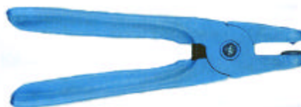
200.221 Ringstar Speciális fogó ívek töréséhez. Anyaga műanyag, hossza 23 cm.