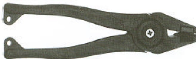
200.205 Fletcher törőfogó Egyenes vagy enyhén ívelt vágások töréséhez. Használatagarantáltan tiszta törésvonalakat eredményez. Kemény műanyagból készül, cserélhető pofákkal. Hossza 152 mm, a pofák szélessége 19 mm.