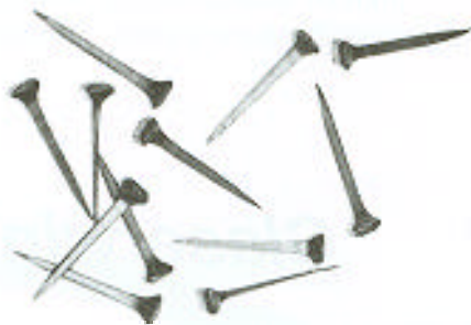
201.803 Patkószög 100 db-os zacskó