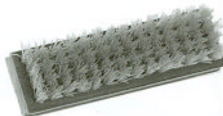
200.402 Gittkefe Ólomprofilok alágitteléséhez.