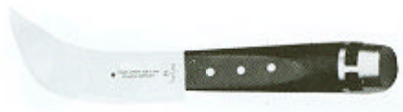
200.302 Don Carlos ólomvágó kés Magas minőségű szerszám, igényes munkákhoz. Pengehossz 10 cm. Keményfa nyél ólom végződéssel.