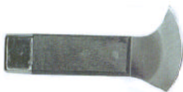
200.301 Ólomvágó kés Keményfa nyéllel. Teljes hossza 125mm, penge szélessége 65mm.