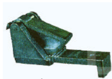
200.405 Ólomnyújtó Visszahúzó rugóval.