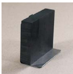
956.215 Grafit lap Gázégőre szerelhető.