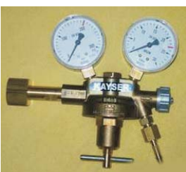
956.180 Nyomásszabályzó manométerrel PB gázhoz