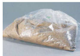
956.972 Vermiculite Szigetelőanyag üveggyöngyök hűtéséhez 450g