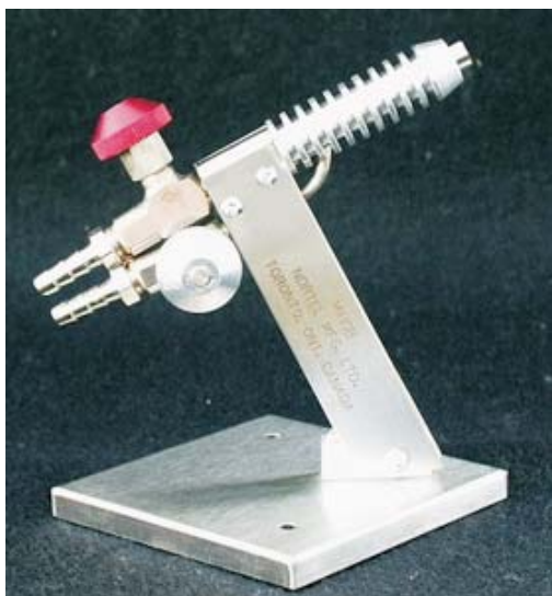
956.080 Asztali gázégő PB gázhoz és oxigénhez. Állítható lángméret.