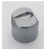
956.401 Körte 20x11mm