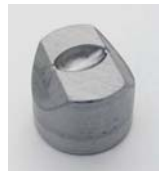
956.402 Oliva2 20x11mm