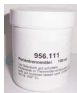
956.111 Pálcabevonó Gyöngykészítéshez 100 ml