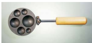
956.471 Grafit formázó Gömb formákkal, fa nyéllel