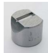
956.404 Henger 20x11mm