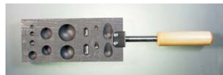
956.470 Grafit formázó 14 különböző formával, fa nyéllel