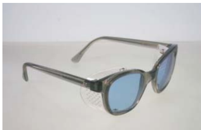
956.059A Didymium védőszemüveg AV-2000