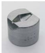
956.403 Orsó 28x11mm