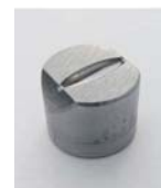
956.405 Orsó 26x8mm