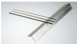
956.998A Pálca tartó 250 mm hosszú, alumínium.