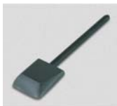
956.218 Grafitlap csapott éllel fa nyéllel 50x75mm