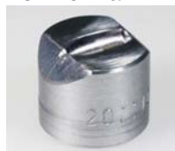
956.400 Ovális 20x11mm