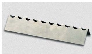
956.998 Pálca tartó Rozsdamentes acél. 200 mm hosszú.